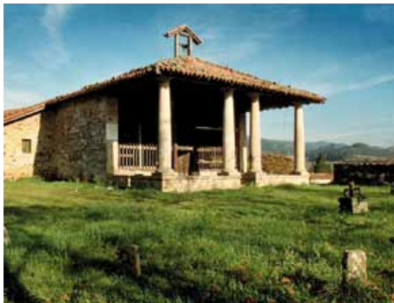
Gerediagako basiliza, 90.eko hamarkadan.