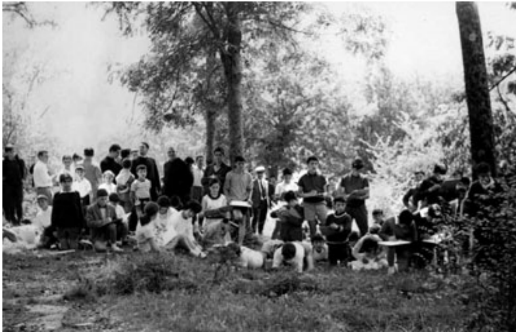
Durango Merinaldeko haur marrazkien txapelketa, finala Izurtzan 1966.

Ordezkaritzen jarduna oso desberdina izan zen herri batzuen eta besteen artean. Horietako batzuk herri bakoitzeko kultura eta gizarte alorreko motore nagusiak izan ziren, euren inguruan jende eta jarduera ugari bildu zituztelako. Kasu gehienetan, gaur egun jarduera hori ez da ezagutzen edo garrantzi gutxi ematen zaio.