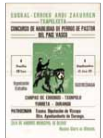
II. Euskal Herriko Artzain Txakur Txapelketako kartela, Iurretan 1968.