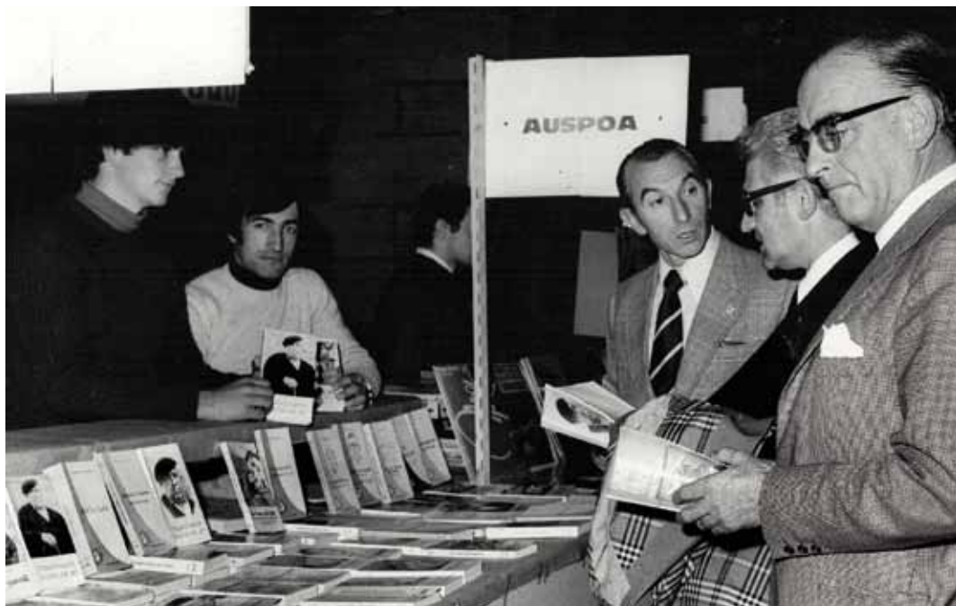
Durangoko Euskal Liburu eta Disko Azoka.