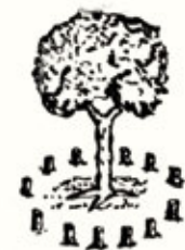
Gerediaga Elkartearen lehen ikurra.