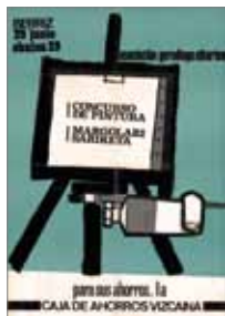
I Margolari sariketa, Berrizen 1971.

Ondoren, ordezkariak hiru sekziotan banatzea erabaki zen, bitan banatu beharrean. Anbotokoari eta Oizkoari, lau hiribilduak jasotzen zituen hirugarrena gehitu zitzaion.