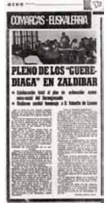
VIII. Merinalde Eguna, Zaldibarren 1972. M.A. Astiz.