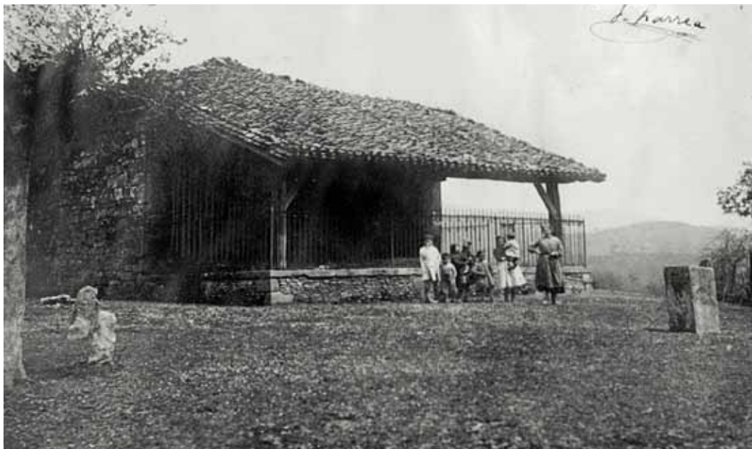
Gerediagako foru gunea XX. mendearen hasieran.