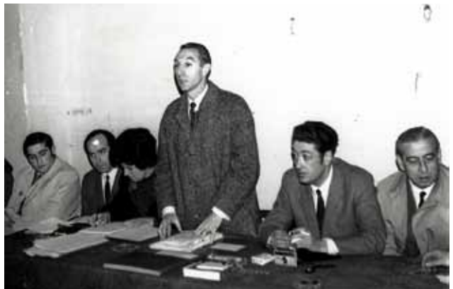
Guerediagako Batzar Nagusia, Astolan 1970.