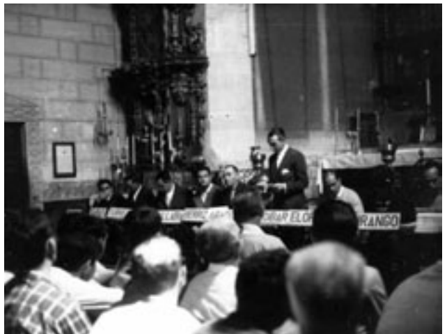
III. Merinalde Eguna, San Agustin Etxebarrin 1967.