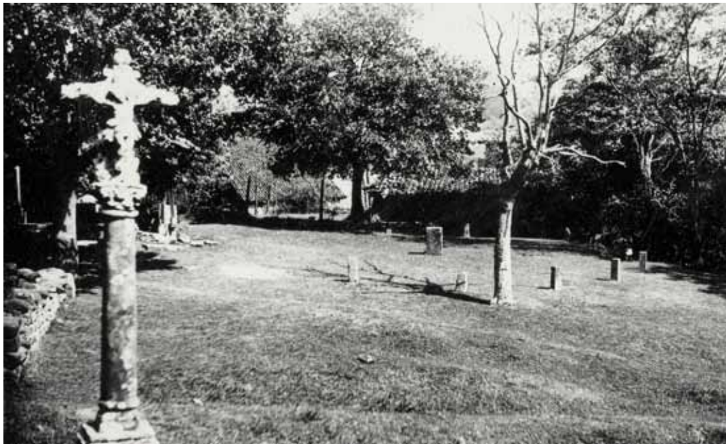
Gerediagako foru gunea 40.eko hamarkadan. B. Lasuen.