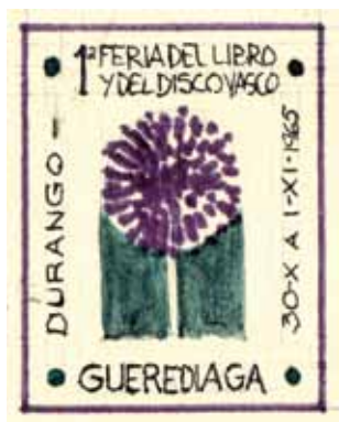
I. Durangoko Euskal Liburu eta Disko Azokako zigilua, 1965.

Sartutako kide berri haietako asko berehala jabetu ziren euren nortasun helburuak indartzeko aukeraz, Merinaldeko mugetatik haraindi oihartzuna izango zuten ekimenak martxan jartzeko aitorten ofizialaren zain egon ez zen elkarte haren bitartez.