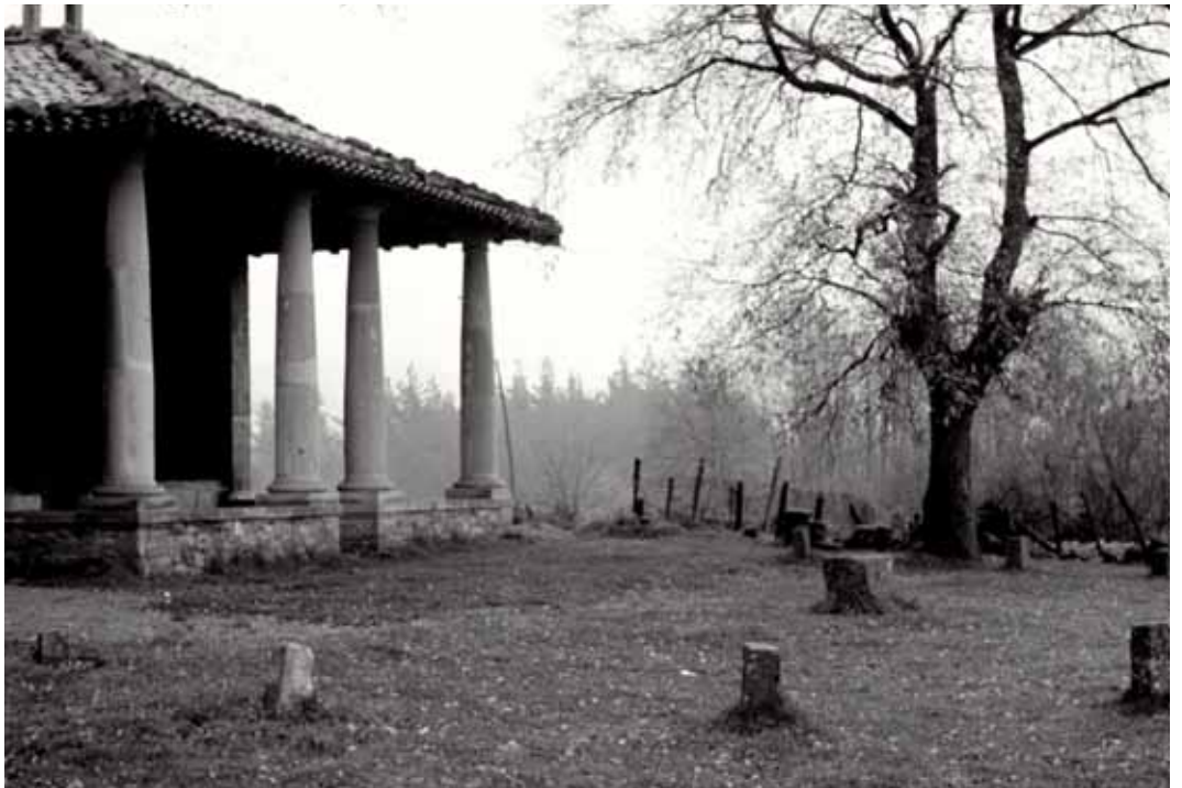
Gerediagako basiliza, 1974.