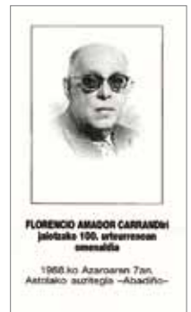
Carrandiren omenaldirako kartela, 1988.

Testu hori honela hasten da: “Es el Archivo de la Tenencia de Corregimiento de la Merindad de Durango, no sólo una curiosidad desconocida, sino un interesante depósito de documentos que pueden utilizarse para construir una parte de la Historia de Vizcaya, tan típica, tan peculiar, tan propia, que ha de formarse con la suma de investigaciones minuciosas de cada una de las diferentes variedades que la integran”. ➤