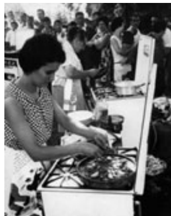
Sukaldaritza txapelketa, Gerediagako basilizian 1966.