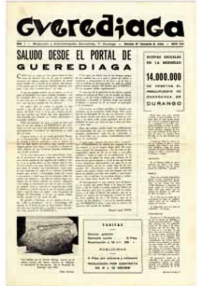
“Guerediaga” urtekariaren lehen alea, 1966.

Bere bizitza laburrean, Guerediaga aldizkariaren orriek elkarteari, proiektu ofizialei, Durangaldeko herrien beharrei, buruzko informazioa, historiari, idazleei, pertsonaiei, baselizei, arteari... buruzko artikuluak eskaini zituzten. Garaia, baliabideak eta “inguru-nea” kontuan izanda, bere betebeharra duintasun handiz bete zuela esan behar da.