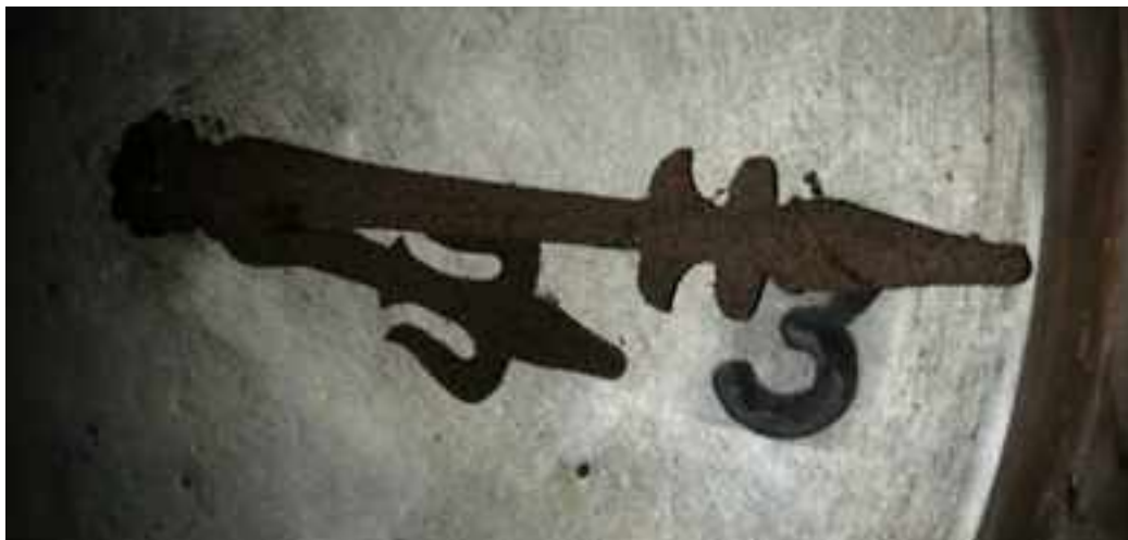
San Agustin, Elorrio

ERLOJURIK gabeko mundua imajinatzea ezinezkoa egiten zaigu. Gizakiak betidanik izan du denbora neurtzeko premia; oinarrizko zatiketarik, gaua eta eguna bereizten; zatiketa konplexua-goetara, denbora urte, hilabete, aste, egun, ordu, minutu eta segundoetan banatzen.