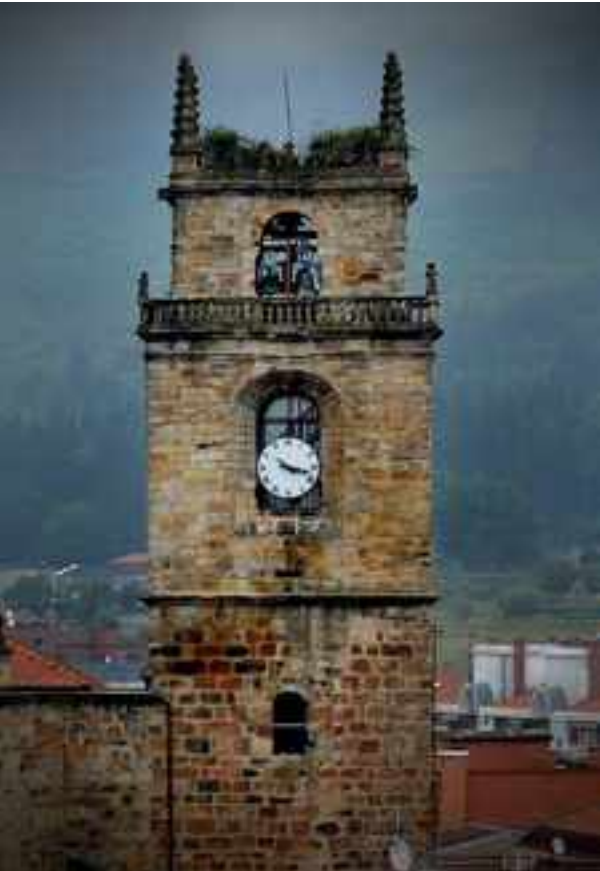
Andra Mariko dorrea, Durango