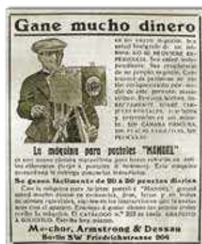
📷 Novedades aldizkari iragarkia, 1913. urtean.

Argazkilariak jende asko elkartzen zen eta argi baldintza onak zituzten lekuetan egoten ziren. Bezeroa aurretik erabakitako lekuan jartzen zuten, dekoratuaren ondoan, kamerek alboan zeramatzen ispilu txiki baten aurrean ilea apaintzeko orrazia eskaini ondoren. Mahuka-erdiaren hutsunetik begiratzen zuten argazkia fokatzeko eta, paper sentsibilizatua kristalean jarri eta bezeroari guztiz geldik egoteko eskatu ondoren, haren arreta erakartzen saiatzen zen, honelako esamoldeekin: Begiratu txoriari! Begiratu hona, txoriak irten behar du eta! Horren ostean objektiboaren tapa kendu edo obturadorea sakatzen zuten, kalkulatuta zeukan denboran eta... Prest!... lehen partea. Orduan, besoa sartuz kamera barruan egin beharreko lana hasten zen, papera eta errebelatzeko eta finkatzeko likidoak manipulatu, paper gaineko negatiboa lortzeko. Horren ondoren, negatiboa beso artikulatuan jartzen zuten, objektiboaren aurrean, eta argazki