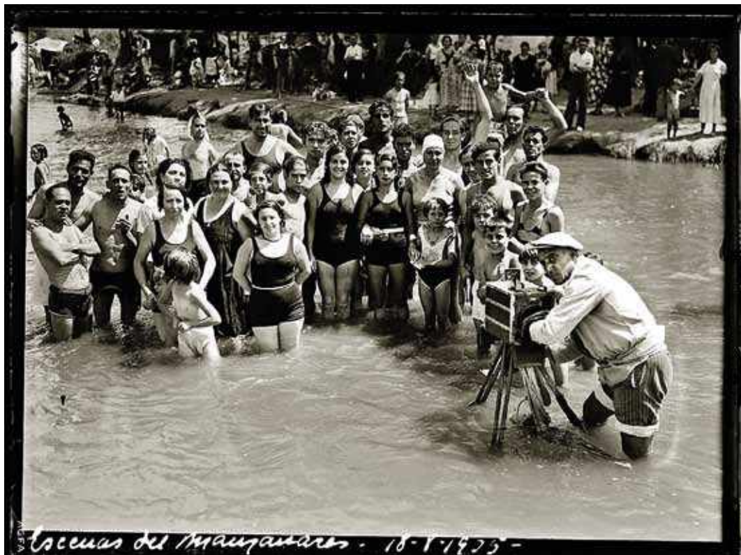
📷 Minuteroa Madrilen, Manzanares ibaian, 1935. urtean.

Gerra zibilaren (1936-1939) ondoren, lan prekarietatearen ondorioz argazkilari horien kopurua biderkatu egin zen. Gehienetan lanpostu bat baino gehiago zituzten pertsonak ziren, eta udan batez ere, aurretik prestatutako ibilbidea egiten zuten, jai guztietatik, autobusetan, trenetan, gurdietan edo ahal zuten moduan, errepiderik ere ez zegoen lekuetara heltzeko. Azoka garrantzitsuak zeuden herrietan euren jardura araututa zegoen, eta beharrezko baimenak eskatu eta hainbat baldintza bete behar zituzten, pertsonen joan-etorria ez tratatzea, adibidez. Herri garrantzitsu horietan, minutero batzuek postu finkoa zuten parke edo plaza jakin batzuetan. 1960ko hamarkadatik aurrera kopuruak