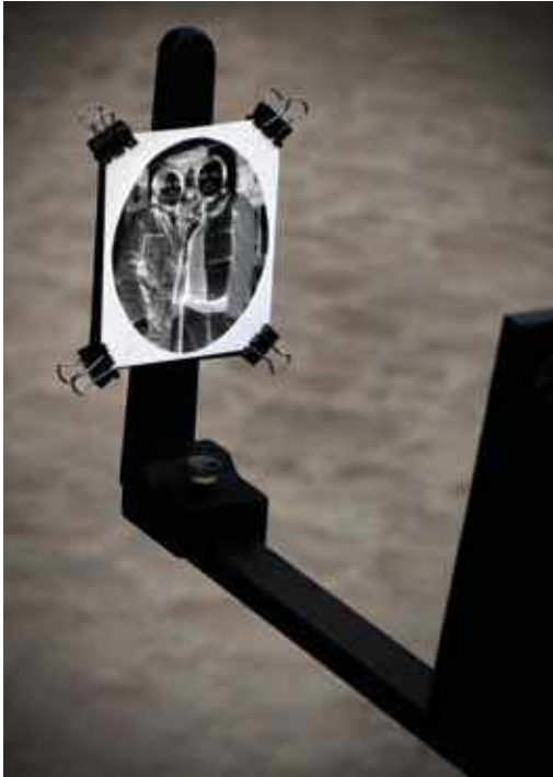
📷 Erretrato baten negatiboa paperean, positiboa egiteko prest.

riko erredaktoreak, atxilotu egin zuten, Durangora zihoan kamioi batean. Bertan deskribatzen zenez, “fotógrafo ambulante, que, con sus pertrechos de <al minuto>, esperaba hacer un espléndido negocio con los milicianos que él creía estaban defendiendo Durango” . Antza, ez zekien bi egun lehenago Durango altxatutakoen esku erorita zegoela.