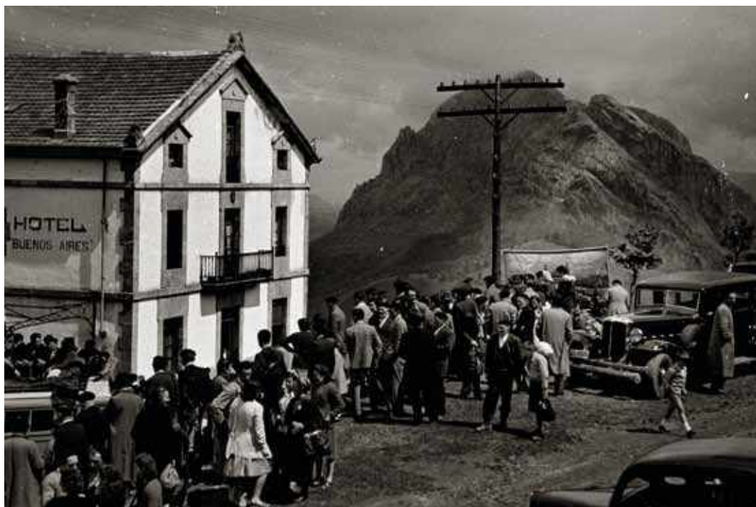
📷 Minuteroa bere dekoratuarekin Urkiolan, 1950.