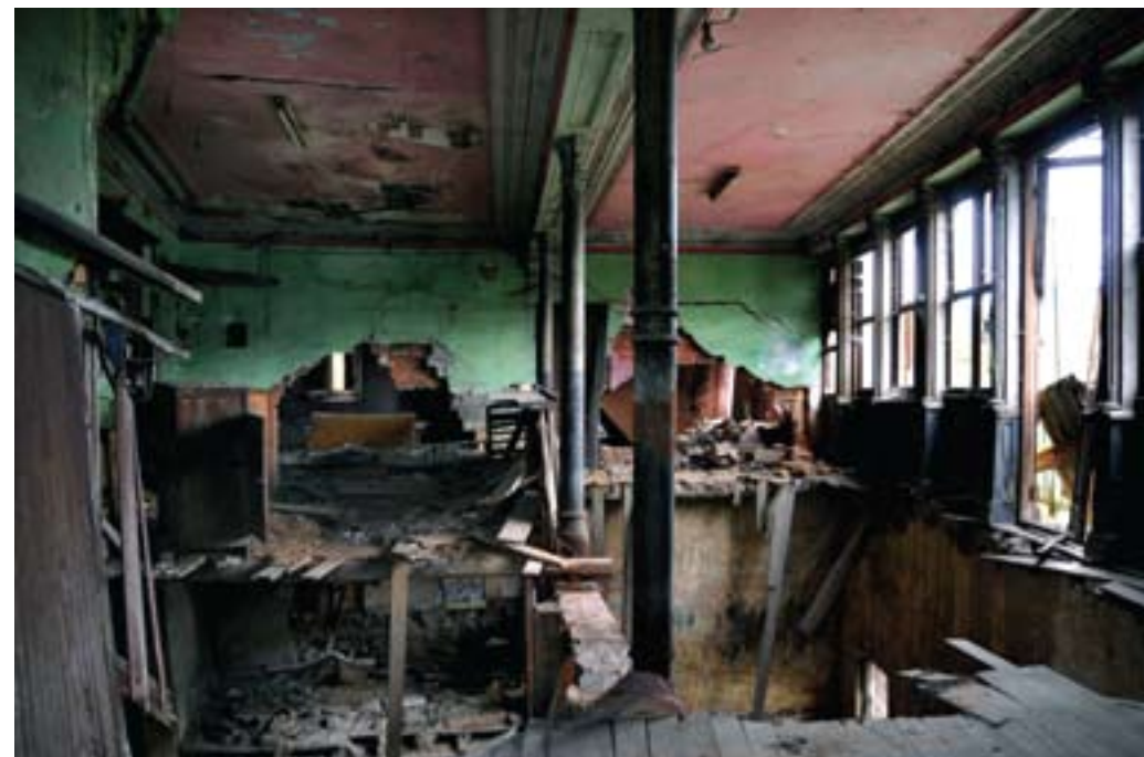
Boluetako fabrikako antzinako eraikuntzak

beste toki manufakturatzaile famatuetan bezala. Dirutza maileguz ematen zuten, korrituetaz laguntzarako baliatzeko. Baldintzak kanpoko finantzarienak baino leunagoak ziren txanponen kokapena ziurtatzeko, auzokoak laguntzeko eta -adi!- "dirua geldi gera ez zedin, uriko merkataritzaren kaltetan", dioskue. Bai ulermen zorrotza! Gain-produkzio krisialdian ez zen komenigarria bitartekariak deskapitalizatzea; bezeriari bermea eman behar zion, beste hornitzaileengana joan ez zedin. Sakrifizioak merezi zuten. Ekoizpena normalizatu zen eta 1850. urtearen inguruan otxandiokoen aietasuna nabaria zen. Greziarren burdinagile-jainkoa zen Vulkanok, edozein burdinagileren erretratua izan daitekeenak, data horretatik Herriko Plaza erdian dagoen monumentutik harrotasunaz begiratzen gaitu.