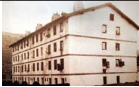
Boluetako “Otxandio-en” etxea

Hasteko, 1854an ermandade antzeko konponbideei agur egin zien eta Gasteizko bitartekarien menpekotasunetik askatzeko