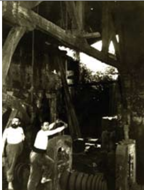
📍 Lebario burdinola. Abadiño.

Gure ibilbideari jarraituz, ingurukoaren gabetasun batez konturatuko gara: ia jaioberriak diren ibaiek ez dute ur korronte emaritsurik. Ur falta erlatiboa zen eta, batzuetan, benetakoa; udarik lehorrenetan iturburuak eta putzuak agortuta zeuden eta disenteriak gupidagabeki ume eta zaharren