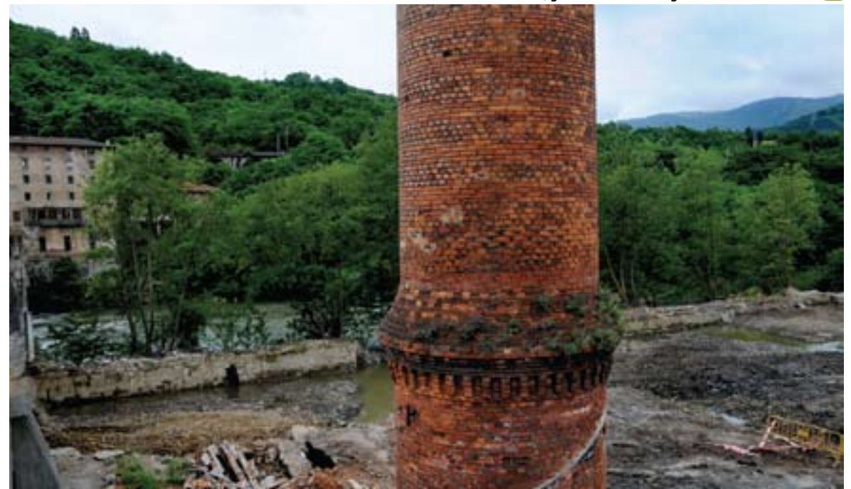
"Santa Ana"ren orubea, geure historiaren atal garrantzitsu baten lekukoa 📍

okela- eta lor-abelgorriak eta basoak zaintzeko; merkatari gutxi, baina gisakoak; bizpahiru ostalari, burdinen bila egunero etortzen ziren mandazainei atsedena eta lapikoko gizenak (tokiko patata goxoz eginda) eskaintzeko; medikua, apaizak, maisua; baina ia besterik ez zegoen -ez zen behar- aspaldi horretan. Ezinbesteko ogia garraiolariak Gasteizko labeetatik erreta ekartzen zuten; zergatia ez da zaila asmatzeko. Espezializazioak maitasuna baldintzatzen zuen ere. Tailer nagusiek etxeokandrea fina ez soilik, senarra gaixotzean edo alarguntsa geratzean negozioa zuzentzeko gai izan zitekeen laguntzailea bilatzen zuten, logikoki lankideen alaben artean. Udalaren monokromia endogamia pertsonala bezain nabaria zen. Azalduko dugun krisialdiak ez zituen ezkontza ereduak aldatu; politikan, aldiz, karlisten eta liberalen arteko gatazka sortu zuen, burdinalangile eta banatzaile guztien asmoak berdinez izategatik. Ikus dezagun zertan bereizten ziren.