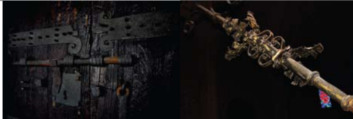
Errementariak Otxandioko elizan egindako lanak

eskaintzeko. Erabakirik garrantzitsuenak guztien artean hartzen ziren; hala ere, tailer gehiegirik egon ez zedin, ekoizpena murriztuz prezioak behera ez zitezen, langile hutsek maisutza-azterketa egiteko aukera gutxi zuten; "ofizial" hauetariko askok ugazabei lan-indarra merke saldu egin behar zien, goragotzeko itxaropenik gabe.