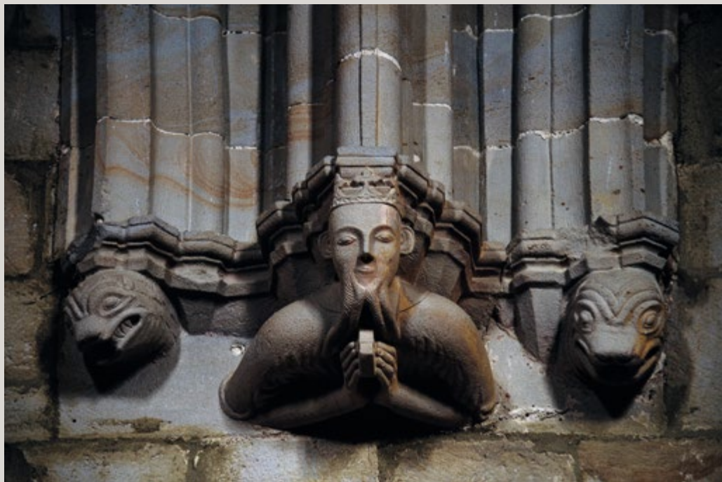
San Agustín elizako irudia.

badakigu XI. mendetik XIII.aren hasierara Durangoko lurra Bizkaia eta Gaztelako Erresumari lotuta egotetik Nafarroako Korora pasa zela zenbait alditan. Hortaz, benetakoa ez bada, baliteke Durangoko kondeena eta San Agustín de Etxebarriaren fundazioarena XII-XIII. mendeetako borroka politikoen testuinguruan sorturiko istorio apokrifoa izatea.