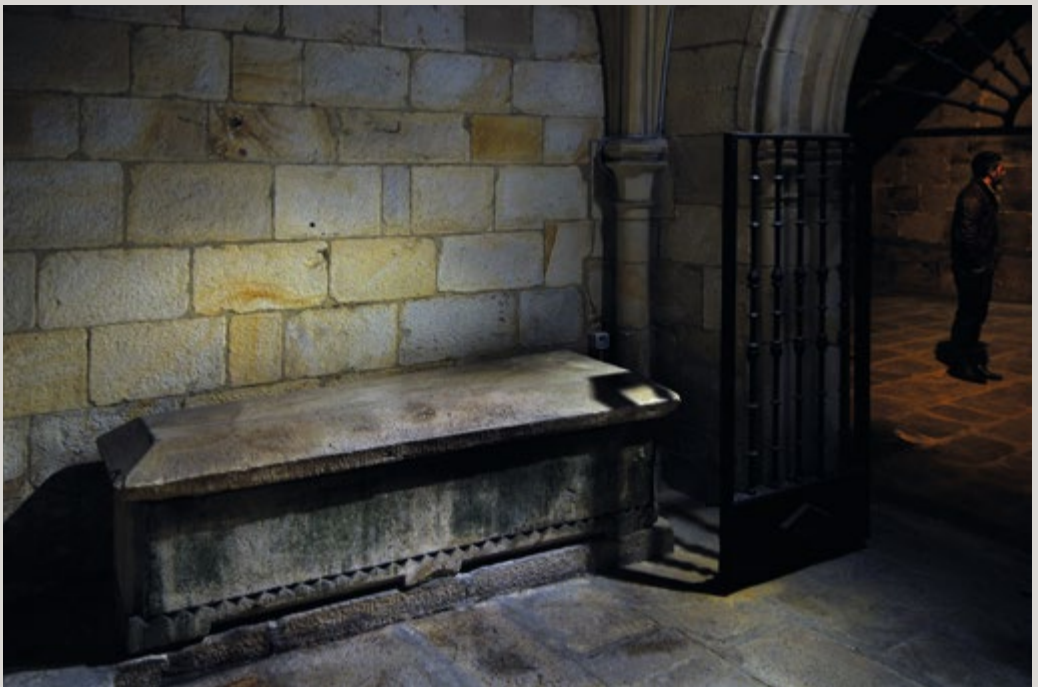
📷 Durangoko kondeen hilobiak San Agustinen.