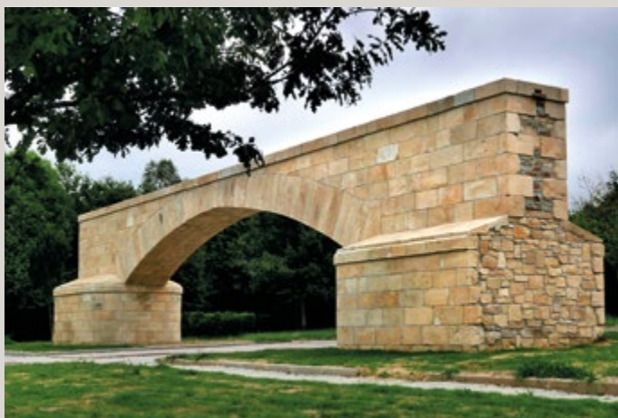
📷 Deabruaren zubiaren desmuntatzea eta zubia Zuhatzola parkean.