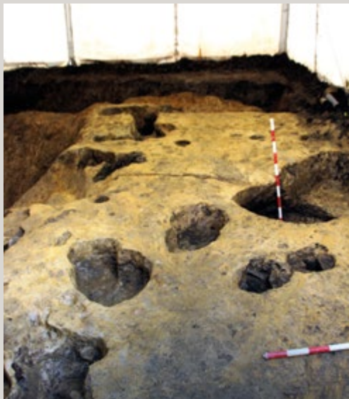
📷 Goi Erdi Aroko herrixkako zutoin-zuloak.

Aldaketa benetan erradikala XIV. mendean iritsi zen, bertan 5 metroko zabalera eta 3 metroko sakonera zuten buztinean zulatutako lubaki bat eraiki zenean,