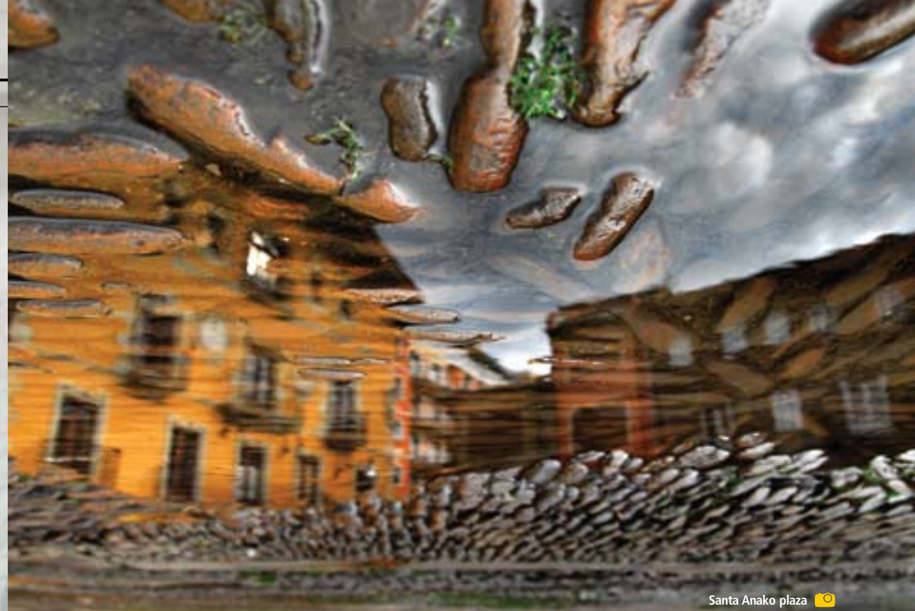
Santa Anako plaza

Gorantz jarraituko dugu, beti mendiaren erditik, Ibaizabal bailararen eta mendikatearen panoramika zabala atzean utzirik. Asfaltozko auzo-bide batera iritsiko gara. Bide horrek