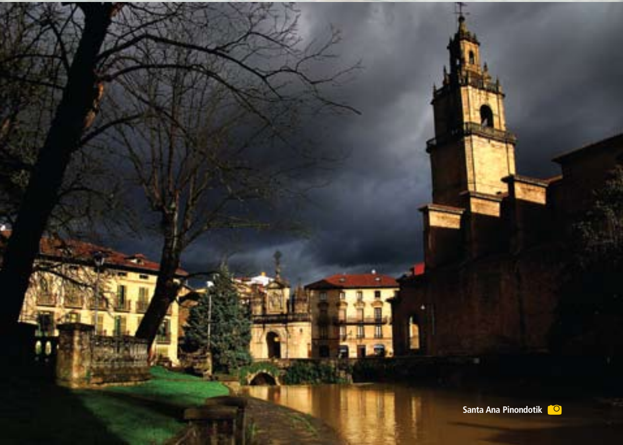
Santa Ana Pinondotik

laster, Momoition, bat egingo du beste bide garrantzitsuago batekin.