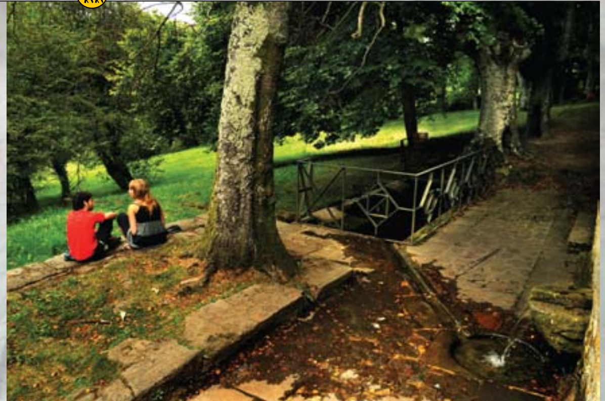
Santa Apoloniako iturria. Urkiola

batetik jaisten hasiko gara pixkanaka, harik eta arditegi batera iritsi arte. Bai erreferentzia horrek, bai agertutako panoramika zabalak (pagoak eta koniferoak atzean utzirik) Urkiolara iristen ari garela iragarriko digute.