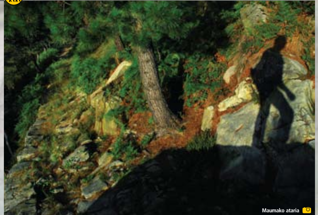
Maumako ataria ☉

Lekeitioko hiribildura iritsi gaitzke. Errekaren ondotik jarraituta, kortabasoak, burdinolak eta errotak ikusiko ditugu, Erdi Aroko herri horretara heldu orduko. Lekeition hondartzak eta ontziolak aurkituko ditugu. 35 km inguruko bidea da, baina horren berri hurrengo batean emango dizuet.