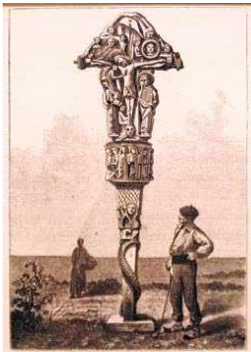
Grabado de "El Oasis". 1880.

Es casi milagroso que la cruz de Kurutziaga haya sobrevivido a su aciaga historia. Ignorada como elemento artístico hasta la segunda mitad del siglo XIX, es en esa época donde comienza su calvario, con repetidos traslados, agresiones con explosivos, restauraciones dudosas, desamparo ante los fenómenos atmosféricos y contaminación. Sus múltiples cicatrices dan fe de todo ello. Esta sería la cronología de su accidentada existencia: