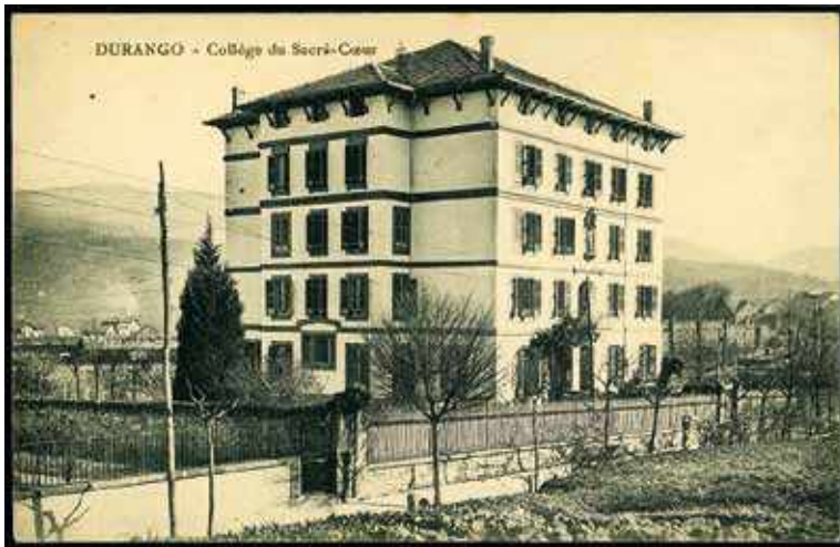
📍 “Las Francesas” ikastetxea gerra aurrean.

Garaituak izanaren kontzientzia inposatze-ko, faxistek emakumeak animalien antzera tratatzen zituzten. Komentuetako getelan andrak pilatzen zituzten. Ez zegoen komunik, dutxarrik, oherik... Presoek zoruan lo egiten zuten, albo batez, denentzako lekurik ez zegoelako. Gainera, gizonezkoek ez bezala, emakumeek euren seme-alaben ardura hartzen zuten, faxistek umeak ere preso hartzen baitzituzten, jatekorik ematen ez bazieten ere. Baldintza horien bitartez, emakumeei urteetan hilekoa kentzen zieten.