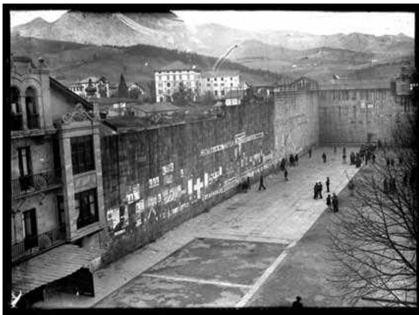
📍 Ezkurdiko frontoia. Atzekaldean, Nevers ikastetxea. Ca.1935.