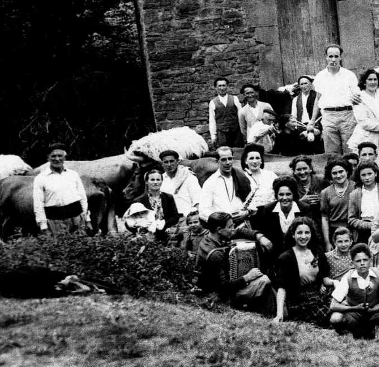
© Ezkontza Gatzagan (Zaldibar). Ilargi Zaldibarko argazki taldea.

Zentzu gehiegirik ez badu probintzia berean, edo eskualde berean horrelako ezberdintasunak ego- tea, herri baten barruan, kale eta atariaren arabe- ra ere batzuetan ezberdintasun hoiak jasan behar izanak erabat ulertezina da. Gainera, behar den zorroztasunekin ez dago jakiterik forugabeko udal hoietan non dauden zuzenbide bien arteko lur ezarpen eremu mugak, nortzuk diren forudunak