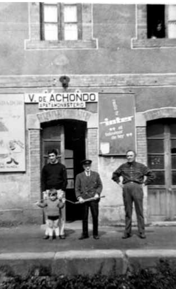
📍 Apatamonasterioko tren geltokia. Ca.1970.