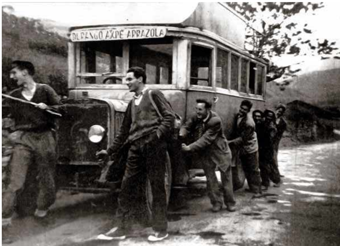
🕒 Atxondoko "Pullman" zaharra. Eraz aldizkariko artxiboa.

tan hiru herriekiko 155 etxeetatik, 121 su hermandadean elkartuta ageri dira. Anaitasun honek XVIII eta XIX. mendeetan zehar jarraitu zuen eta baita XX. mendean ere. 1994. urtean Durangaldeko eta Arratiako baserrien artean, "Etxe-erre batze"-aren ohitura berreskuratzen saiatu ziren Mendikoa baserriko sutea izan eta gero.